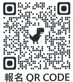
報名 QR CODE