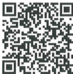
會議連結 QR code