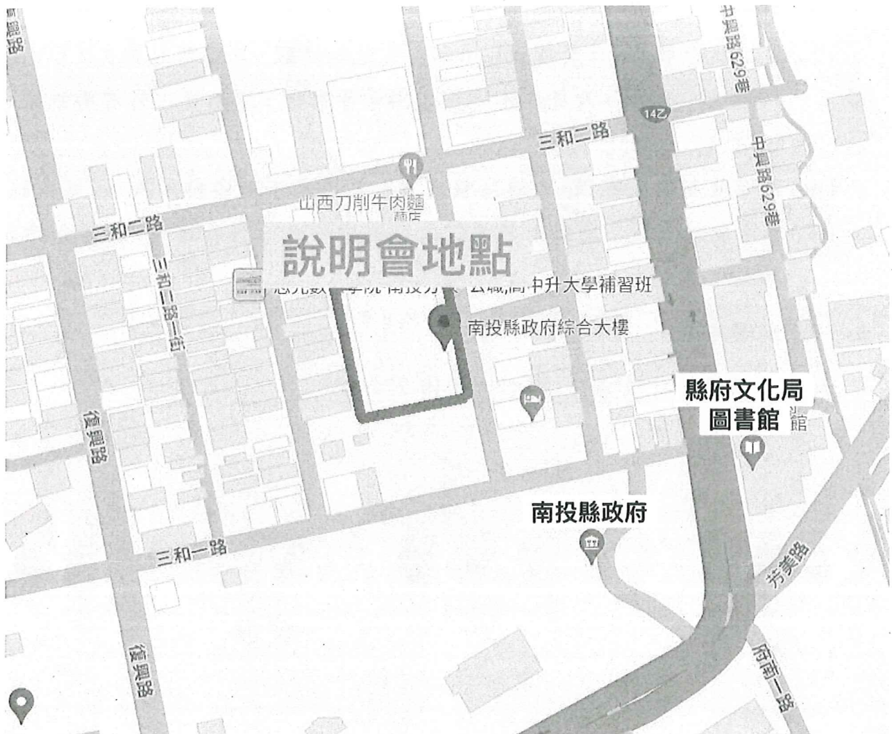
圖1 說明會地點示意圖